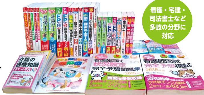
看護・宅建・ 司法書士など 多岐の分野に 対応