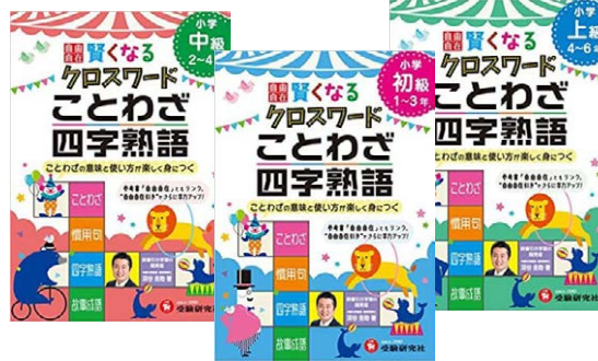
【増進堂・受験研究社】