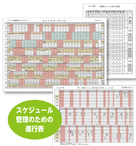
スケジュール 管理のための 進行表