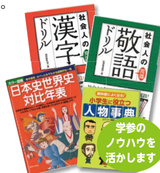
学参の ノウハウを 活かします

大人向け「脳トレ」ドリル（漢字、計算、敬語、ペン字、京都、ことわざ、人体、地図、歴史人物、昭和、クロスワードなど）の制作一式は、お任せください！