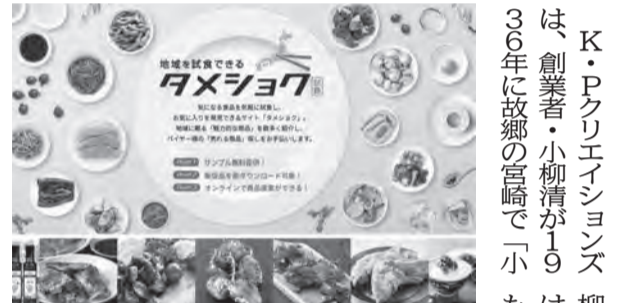
「タメシヨク」の公式サイト