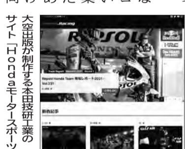
本田が制作する本田研究のサイト「Honda.com」