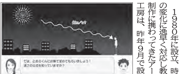
第15回AJEC大賞 デジタル・IT部門賞受賞作