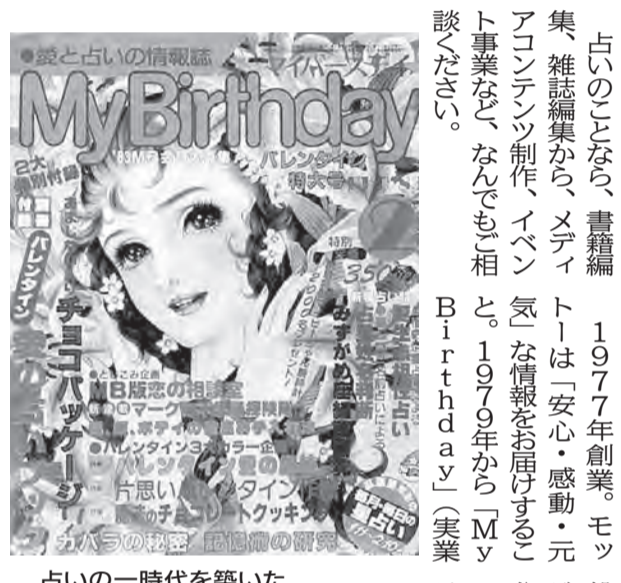
占いの一時代を築いた「My Birthday」1983年2月号